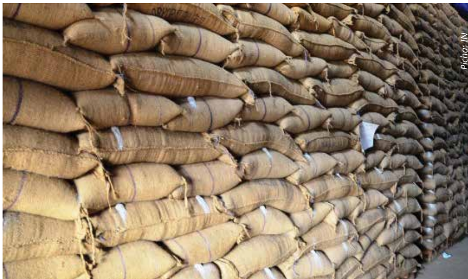
Hakikisha unapanga magunia kwa kupishanisha ili kuruhusu mzunguko wa hewa.

Ghala hili hujengwa kwa kutumia bati la chuma au matofali ya kuchoma au ya sementi. Masalio ya bati hayafai kutumia kujengea hasa katika maeneo