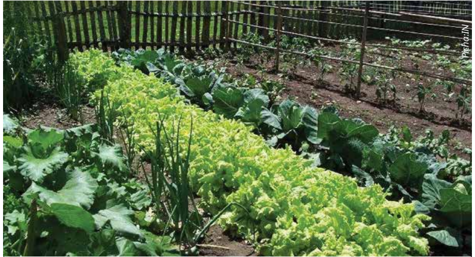
Ni muhimu kwa wakulima kuzingatia misingi ya uzalishaji wa kilimo hai.

Anaongeza kuwa, wakulima wengi wamekuwa wakilalamika kuwa