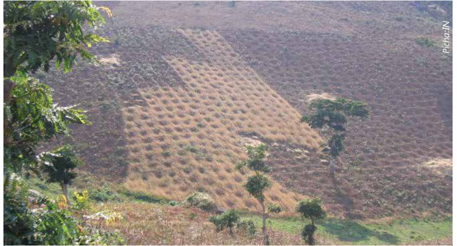
Kilimo cha Ngoro husaidia kuhifadhi udongo na kuzuia mmomonyoko wa ardhi.

Inaaminika kuwa kilimo cha ngoro kinahusishwa na shughuli za kuwepo kwa mapango ya kuishi ambapo wazee