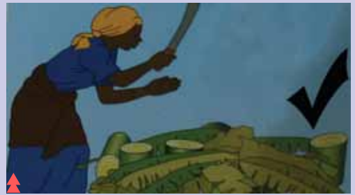
Fyeka migomba yote iliyoathirika.

Ondoa ua dume kuzuia kuenea kwa ugonjwa.