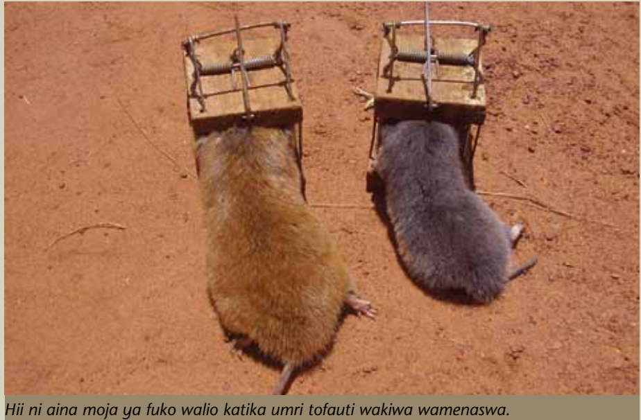
Hii ni aina moja ya fuko walio katika umri tofauti wakiwa wamenaswa.

Fuko hula mizizi ya mazao na sehemu ya chini ya shina la mmea husika pamoja na mazao yenyewe,