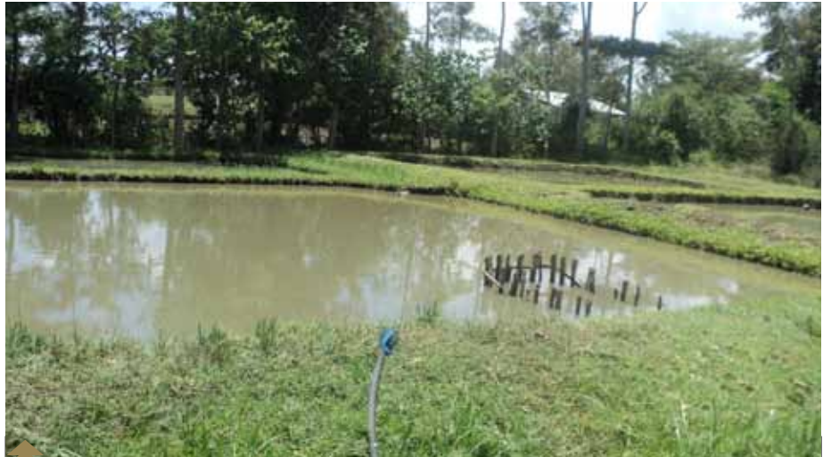
Ni muhimu kuzingatia utunzaji wa bwawa na kuhakikisha ni safi wakati wote. Samaki wanapotunzwa vizuri huzaliana kwa haraka na kuongeza pato la mfugaji.

Kuna njia ya kupunguza maji na kuongeza maji pindi hali ya ukijani ndani ya bwawa inapokuwa imezidi. Kwa kufanya hivi, maji yatakuwa salama. Zoezi hili unaweza kulifanya mara moja kwa mwezi au zaidi kutegemea na hali ya ukijani imeongezeka kiasi gani. Mambo ambayo mfugaji inabidi aan-