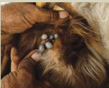
Kupe hupendelea sehemu zilizojificha kwenye mwili wa mnyama.

Tumbaku: Chukua kilo moja ya majani mabichi ya tumbaku, tumbukiza katika maji lita 10 kisha iache kwa muda wa dakika tatu. Tumia kitambaa safi kumpaka ng'ombe. Lita 5 zinatoshwa kwa ng'ombe mmoja. ■