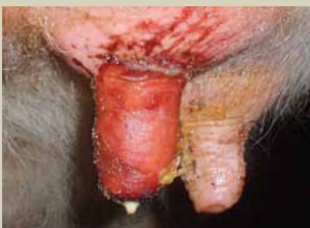
Titi la ng'ombe aliyeathiriwa na mastitis huvimba na kuonekana kama aliyejeruhiwa.

Mastitis ni ugonjwa wa kuvimba ziwa unaosababishwa na bakteria hususani jamii ya streptococci na staphylococci ambao wanapatikana zaidi