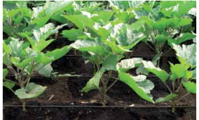
Molasesi inapotumika kwenye umwagiliaji wa matone hushamirisha mazao pamoja na kuboresha udongo.

Kimamba husafirisha virusi kutoka sehemu moja hadi nyingine; Wanaopasafiri na kukutana na kingo hai, hunaswa pale na kwa kubakiza virusi ambavyo hukosa uhai na kutofikia mazao shambani. Inashauriwa kung'oa mimea yote iliyoshambuliwa kabla ya mazao kutoa matunda ili kuondoa kila aina ya wadudu waliopo shambani.