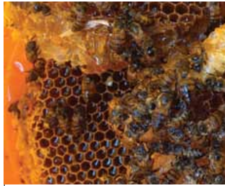
Matumizi ya teknolojia sahihi humuezesha mfugaji kupata mazao bora.