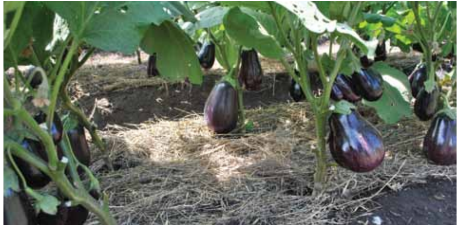
Shamba la bilinganya linafaa kuwa safi wakati wote ili kuepuka wadudu waharibifu.

Ni muhimu kwa mkulima kuwa na trei maalumu kwa ajili ya kusia mbegu