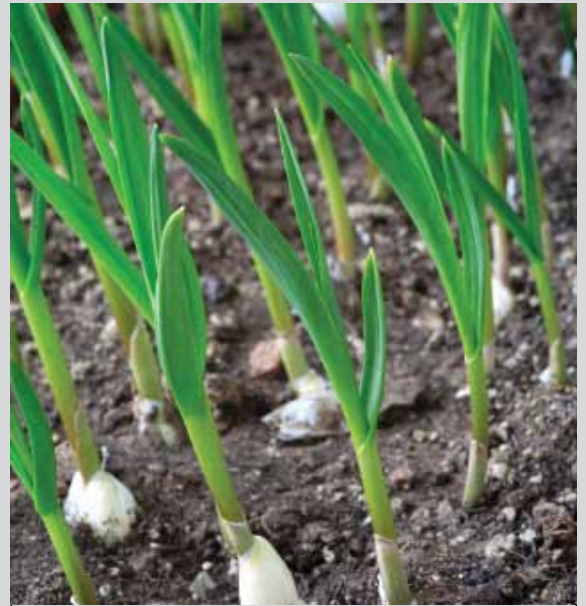
Kimtazamo mimea ya vitunguu saumu huonekana dhaifu tofauti na vitunguu maji.

na kuanza kutoa majani. Jani la kati kati ambalo litaweka mbegu litaendelea kukua na kupita majani mengine kwa urefu.