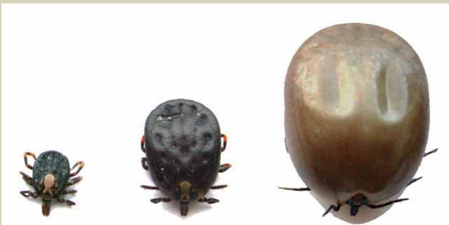
Hizi ni aina tatu za kupe ambao hushambulia mifugo, ng'ombe huathiriwa zaidi.

Ingawa mzunguko wa upuliziaji wa madawa haya hufanyika kila wiki, gharama za udhibiti wa vipimo uko juu sana kwa wakulima wadogo. Kwa mfano, kupiga dipu kwa wiki ni shilingi 1,500 hadi 2,000 kwa ng'ombe mmoja. Hii ni kwa sababu serikali