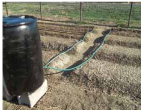
Molasesi huchanganywa kwenye pipa la maji yanayotumika kunyeshea mimea.

Kutokana na tabia hizi za wadudu, kupanda mimea jamii ya nyasi inasaidia wakulima kuwadhhibiti wadudu aina ya Kimamba. Kuweka mazao yenye jamii ya nyasi karibu na bustani au shamba la mboga husaidia kuwapunguza wanaoingia shambani.