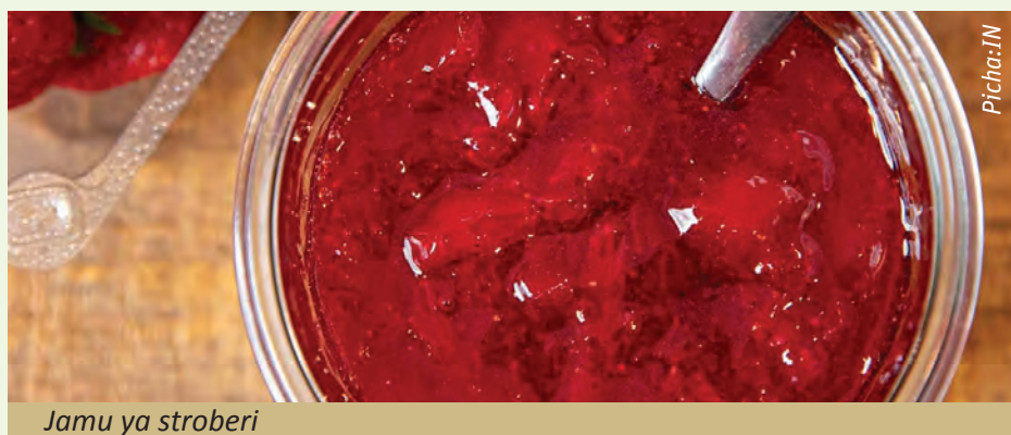
Jamu ya stroberi

Ongeza kiasi cha sukari. Kwa matunda haya unashauriwa utumie vikombe vinne (4) vya sukari kwa vikombe sita (6) vya rojo ya Stroberistroberi. Kumbuka katika utengenezaji huu wa jamu tutatumia pectini hivyo unatakiwa kukoroga mara kwa mara ili pectini iweze kuchanganyika vizuri. Katika hatua hii unashauriwa kuweka vikombe (2-3)