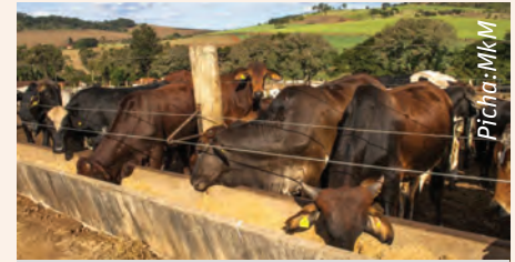
Sehemu ya kulishia lazima ijengwe ili wanyama waweze kuingia na kutoka kwa urahisi na kupata chakula chao cha kila siku bila shida.

Ndama dume wahasiwe baada ya umri wa miezi mitatu au baada ya kuachishwa maziwa kwa njia ya