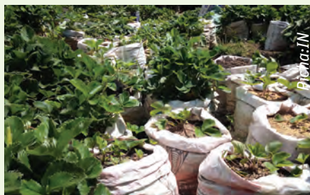
Mamea wa stroberi

III. Sufuria ya wastani. Hii itatumika kuchemshia mchanganyiko wa-ko ambao ni matunda kwa ajili ya kutengeneza jamu. Hapa unashauriwa kutumia sufuria nzito zisizozidiwa na moto mkali, pia iwe rahisi kusafisha baada yakutumia.