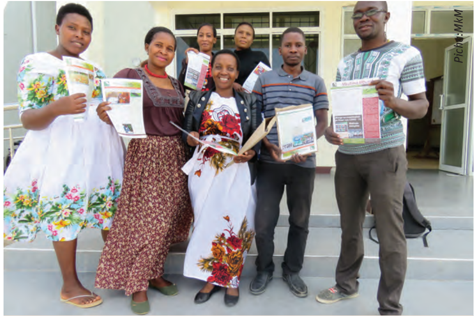
Baadhi ya maafisa ugani baada ya kuchukua jarida kwa ajili ya kufundishia

Pili, tupo tayari kutoa elimu kwenu kuhusu kilimo hai wakati wowote kupitia mtandao au majarida yetu ya