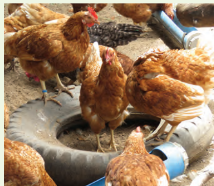
Kuku bora wanatokana na chanjo iliyotolewa kwa wakati sahihi

Wasiliana na maafisa ugani katika eneo lako kwa ushauri zaidi kuhusu muda sahihi na aina ya chanjo mahususi kwa kuku unaofuga. Mkulima Mbunifu ipo kukushauri juu ya chanjo na udhibiti wa magonjwa yanayoambatana na msimu wa masika.