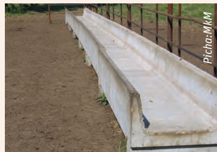
Unaweza pia kutumia matofali na saruji kujenga sehemu ya kulishia

Kwa kutumia chombo cha kulishia, utaweza kuwalisha wanyama wengi kwa wakati mmoja na uamue ni nini au ni kiasi gani cha chakula kinaongezwa kwenye chombo hicho ili uweze kudhibiti kiasi cha malisho ambayo wanaweza kula. Zaidi, zitakusaidia kuweka shamba lako likiwa limepangwa na kukurahisishia kuweka rekodi ya ulaji wa dume wako.