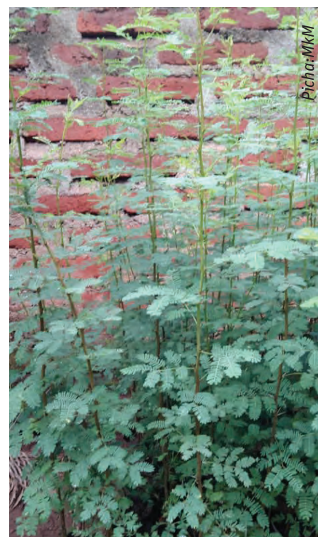
Panda miti ya asili yenye faida

pia baadhi hutumika kama malisho ya mifugo. Mfano wa miti ya malisho ni pamoja na Albizia, Caliandra, na mingineyo)