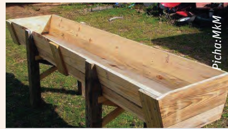
Chombo cha kulishia ambacho kimetengenezwa kwa mbao

Haijalishi ukubwa wa shamba lako, kutumia mfumo maalum wa kulisha itakusaidia kwa njia nyingi hasa unapowalisha ng'ombe wako chakula cha ziada. Ukijenga chombo cha kulishia, malisho hayatapotea wakati wanapewa, na ng'ombe watazoa baada ya muda. Unaweza kujenga