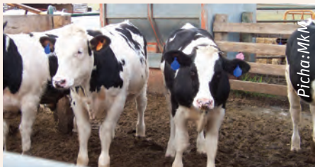
Ndama dume aina ya Fresian wanafugwa kwa mfumo wa ndani kwa ajili ya nyama.

Madume hawapendi kusumbuliwa, kwa hivyo washughulikie kwa uangalifu. Kuwa na daktari wa mifugo karibu ili kuwakagua mara kwa mara hasa madume wapya kabla ya kuwachanganya na madume wengine. Wape chanjo dhidi ya magonjwa sugu katika maeneo yako na dawa dhidi ya vimelea vya ndani kama minyoo. Magonjwa yaenezwayo na kupe kama Ndigana moto ( East Coast Fever ) na Ndigana baridi ( Anaplasmosis )