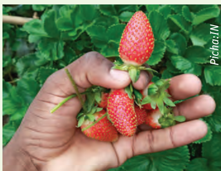
Matunda ya stroberi

I. Sufuria kubwa moja (Canner). Hii inatumika katika kuchemshia jamu wakati ikiwa imeshapakiwa katika vifungashio au makopo maalumu kwa ajili yakuhifadhi jamu. Jamu lazima ichemshwe katika maji ya moto ili kuondoa vijidudu au bakteria.