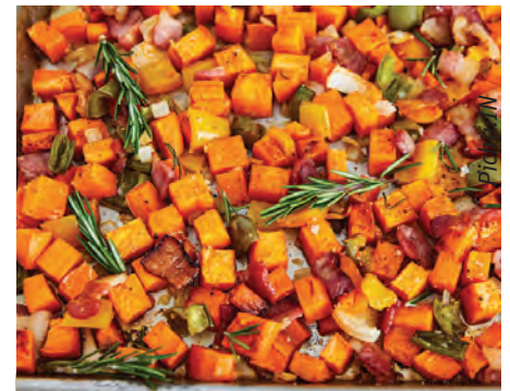
Viazi vitamu vilivyoandaliwa vizuri vinavutia kwa macho na ladha.

Ili kupata virutubisho vya omega-3, samaki aliyechemshwa au aliyekwa ni bora kuliko wa kukaanga, kutia chumvi au kukaushwa. Unaweza pia kuongeza mchuzi wa soya ili kuongeza thamani.