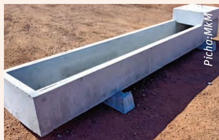
Birika la maji litadumu muda mrefu

Ng'ombe wapatiwe maji safi na ya kutosha. Uchafu unaweza kusumbua shughuli za mmeng'enyoo wa chakula au kusababisha maradhi. Maji yakiwa baridi sana, ng'ombe watahindwa kunywa ya kutosha. Jenga birika