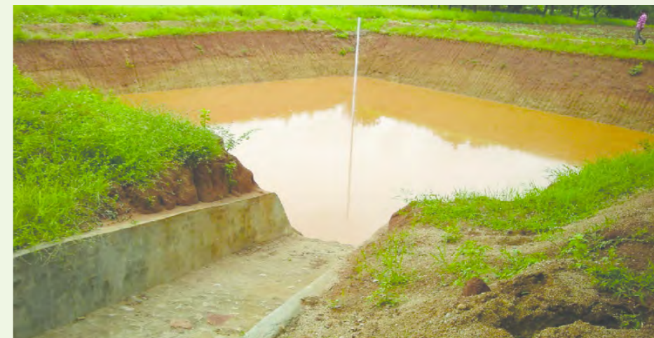
Unaweza kuchimbwa bwawa na kutengeneza mfereji wa kupelekea maji bwawani kwaajili ya kuvuna na kutumia kumwagilia