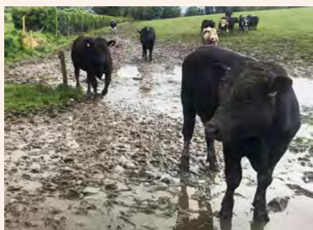
Ufugaji wa mifugo kwa kuchunga msimu wa mvua ni mbaya kwasababu ya matope na maji yanayotua, hii huweza kupelekea ugonjwa wa kwato

Mwanzo wa msimu wa mvua, nyasi huota kwa wingi na kipindi hiki mifugo hupendelea kula majani hayo machanga ambayo kimsingi yanakuwa ni laini na rahisi kwa mifugo kula mengi. Majani haya machanga yanakuwa yamejaa maji kwa sehemu kubwa wakati uhitaji wa mifugo kama ngombe ni majani yaliyokomaa na kuwa na kiwango kikubwa cha nyuzi nyuzi ( fbre content ). Majani hayo yanaweza kusababisha mifugo jamii ya ngombe, mbuzi au kondoo tatizo la kuarisha kwasababu ya ulaini wa majani hayo na mengine yakiwa machanga yanakuwa na kiwango kikubwa cha sumu. Hivyo inaweza kuathiri mifugo ndiyo maana inashauriwa majani