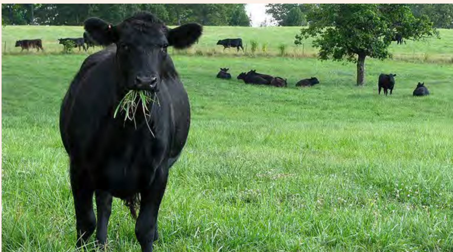
Epuka kulisha mifugo majani machanga kwani kwa kufanya hivyo kutapelekea magonjwa hasa ugonjwa wa kuhara pamoja na kukosekana kwa virutubishi hitajika

yatumike baada ya kufikia katika hatua ya kuchanua maua.