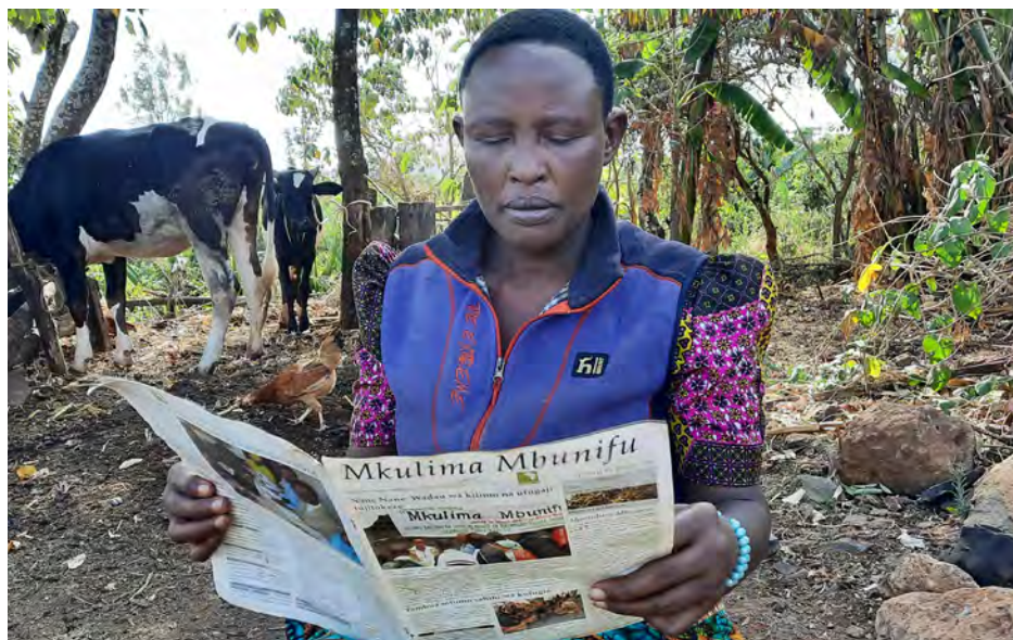
Bi. Magreth akisoma jarida la Mkulima Mbunifu, moja ya nakala yake ya kwanza kupokea mwaka 2017

Bi. Magreth anasema kuwa, katika jarida moja tu la disemba 2017, alikuta kuna taarifa juu ya ufugaji wa kuku yaani namna na mifumo ya ufugaji, faida zake na hasara hivyo ni rahisi