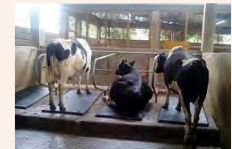
Ng'ombe wanatakiwa kufugwa kwenye banda bora ili kuwapusha na changamoto mbalimbali ikiwemo mvua na magonjwa

Epuka mazingira yafuatayo: maeneo ambayo yanatuamisha maji kwa