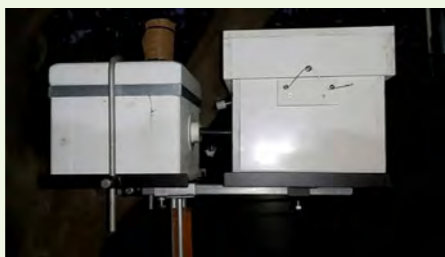
Kugawanya makundi kwa kutmia mizinga

Unaweza kutengeneza mzinga wenye sehemu tatu, sehemu ya chini ya kuingilia nyuki, sehemu ya katikati ambapo ndipo nyumba inapokua na kuongezeka kila siku na sehemu ya juu ambapo ni ya kuhifadhi asali.