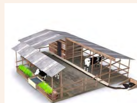
Ni muhimu kujenga banda bora lililopangiliwa ili kuboresha ufugaji na kuepuka magonjwa ya milipuko yatokanayo na uchafu

viii. Kuoza kwa chakula: Chakula cha mifugo ambacho kimekuwa kwenye mazingira