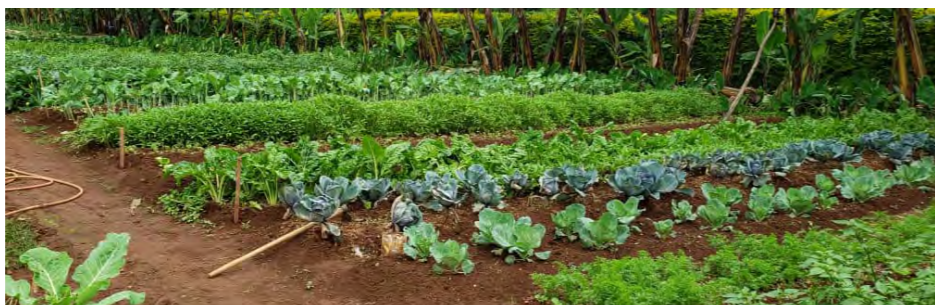
Fanya kilimo kinachozingatia usawa kati ya mimea, udongo, mazingira na wanyama

katika kukinga na kuzuia uharibifu wa mfumo mzima wa mazingira unayojumuisha hali ya hewa, viumbe, bayoanuai, hewa na maji.