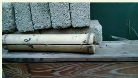
Kugawanya makundi kwa kutumia mianzi

Mwanzi utakaotumika hapa ni jamii ya mianzi yenye pingili nene na ndefu kiasi cha futi moja. Mianzi hii hupatikana sehemu za uwanda wa juu wa baridi wa kitropiki. Mwanzi huu utakatwa katika sehemu yake ya katikati na kugawanywa katikati, kisha kutolewa sehemu zote mbele na nyuma na kusafishwa vizuri.