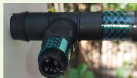
Kugawanya makundi kwa njia ya T- PIPE

Mfugaji anaweza kununua pipe za maji za kawaida za plastiki za upana wa robo tatu kipenyo, na kuweka viungio vya kiwiko kisha kuunganisha katika pipe za maji na mdomo wa kuingilia nyuki katika mzinga.