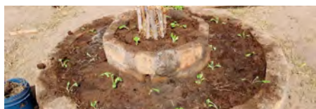
Zingatia matumizi ya teknolojia rahisi kwa utunzaji wa mazingira na uzalishaji unao-tunza afya ya udongo na jamii

Wote wanaozalisha, wanaosindika, wanaouza au kununua, kula na kutumia bidhaa za kilimo hai wanapaswa kushiriki kikamilifu