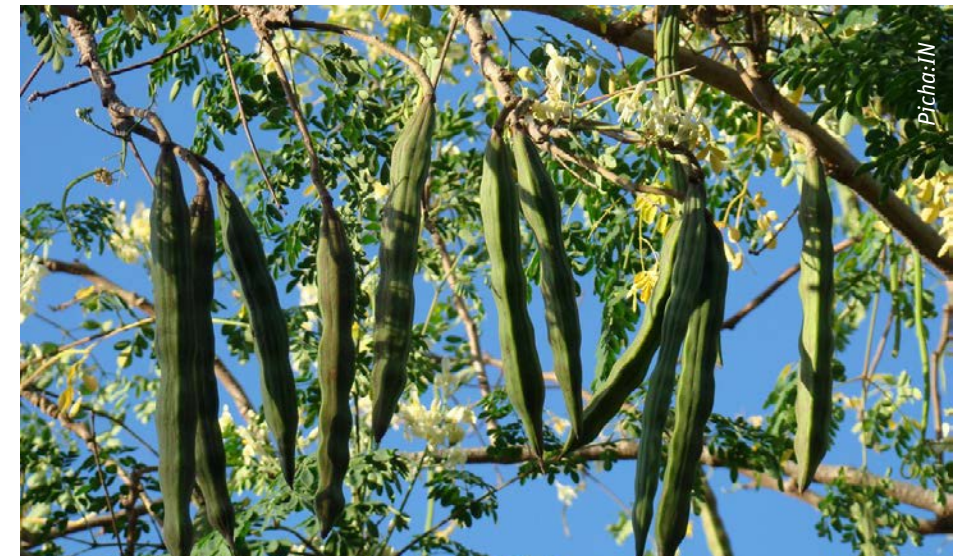
Mapodo yenye mbegu za mlonge ambazo huchumwa kisha kukaushwa na kutolewa mbegu hizo tayarikwa matumizi

mizizi mirefu inayosambaa na hauna kivuli kikubwa; unaweza kutumika kuchanganya na mazao mengine yanayo hitaji kiwango kikubwa cha naitrojeni.