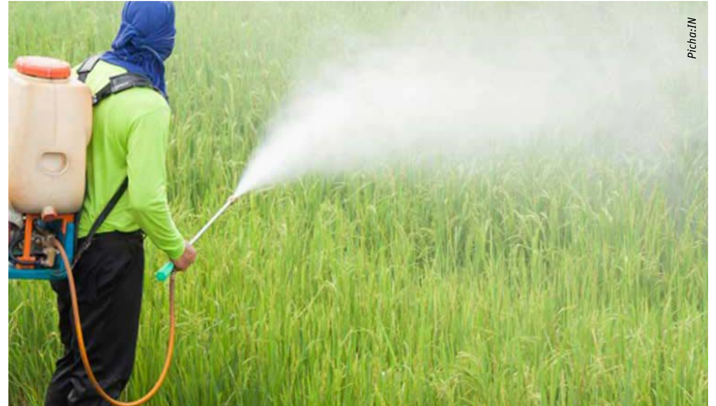
Matumizi ya viuatilifu ni hatari kwa mwili wa binadamu kwani ni rahisi kuingia mwilini

Katika toleo lililopita la juni tulianza kuangazia madhara yasababishwayo na viuatilifu na katika toleo hili tunamalizia mada hii kwa kuangalia njia ambazo sumu huingia mwilini. Mara nyingi wakulima hutumia kemikali kwa matumizi tofauti, bila kufahamu kuwa wao pia wanaathiriwa na madawa hayo. Dawa hizo huingia mwilini kwa njia mbalimbali.