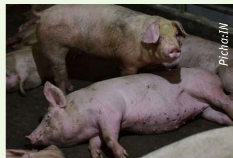
Moja ya dalili ya homa ya Nguruwe ni nguruwe kuzubaa na kukusanyika mahali pamoja

Uchinjaji holela wa nguruwe wanaomwa husababisha virusi kusambaa kwenda kwa nguruwe ambao hawaumwi kwa kulisha mabaki ya nguruwe walioathirika, kushika damu yenye virusi na kisha kwenda kulisha nguruwe, kukanyaga damu yenye virusi machinjioni na kisha kwenda na viatu hivyo kwenye mabanda ya nguruwe ambao hawajaathirika.