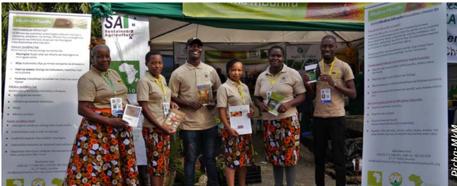
Usikose kutembelea banda la Mkulima Mbunifu katika maonesho ya wakulima Nane Nane, viwanja vya Themi (Njiro) mwaka huu ili ujifunze mengi kuhusu kilimo hai

Hayawi hayawi sasa yamekuwa, nane nane hiyoo imekaribia. Nchini Tanzania, kila mwaka, wakulima na wafugaji hujumuika kwa pamoja kwa muda wa siku takribani kumi kuadhimisha sikukuu ya wakulima nchini. Serehe hizi hufikia kilele siku ya tarehe nane mwezi wa nane.