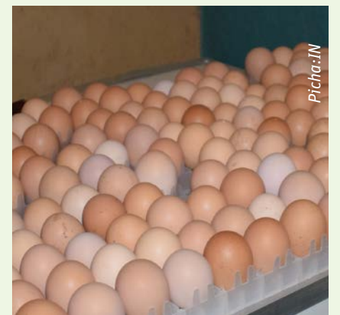
Trei ya mayai

Mkulima Mbunifu ni jarida huru kwa jamii ya wakulima Afrika Mashariki. Jarida hili linaeneza habari za kilimo hai na kuruhusu majadiliano katika Nyanja zote za kilimo endelevu. Jarida hili linatayarishwa kila mwezi na Mkulima Mbunifu , Arusha, ni mojawapo ya mradi wa mawasiliano ya wakulima unaotekelezwa na Biovision ( www.biovision.ch ) kwa ushirikiano na Sustainable Agriculture Tanzania (SAT), ( www.kilimo.org ), Morogoro. Jarida hili linafadhiwa na Biovision Foundation