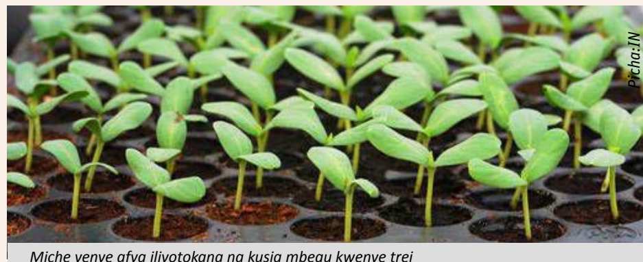
Miche yenye afya iliyotokana na kusia mbegu kwenye trei

Mara unapooni kuna magugu yanajitokeza, ondoa mapema yakiwa bado madogo sana kwa sababu