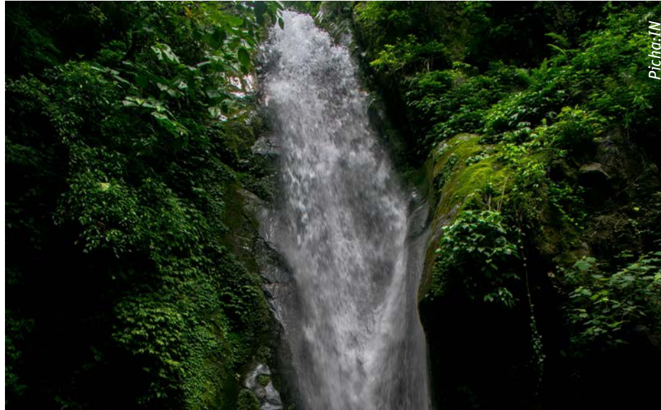
Utunzaji wa vyanzo vya maji hupelekea upatikanaji wa maji mengi kwa matumizi ya jamii

UMHIMU: Utunzaji wa vyanzo vya maji ni faida ya wananchi wote kwani hakuna asiyetegemea maji kuendesha Maisha ya kila siku. Tukitunza vyanzo vya maji mazingira yetu yatakuwa