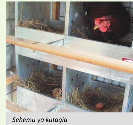
Sehemu ya kutagia

Kuku wanafugwa na jamii nyingi nchini; ni ngumu kupata kaya ambayo haifugi kuku. Hii ni kwa sababu ni ndege anayehitaji eneo na mtaji mdogo kufuga, na anasifika kwa nyama na mayai ambayo ni chakula na pia kuku anaweza kuuzwa kwa haraka ili kugharamia mahitaji kadhaa.