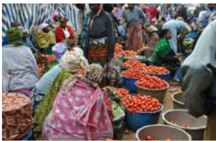
Wakulima wakifanya mambo kwa mipangilio thabiti ni wazi uchumi wao utakuwa.

Yote haya yanaweza kuwa ni majibu sahihi, lakini lililokubwa ni kuwa Mkulima, mfugaji, hupaswi kuwa maskini na hakuna sababu ya kuwa maskini. Wakulima na wafugaji ndio wanaotakiwa kuwa matajiri wa kwanza kisha wengine kufuata.