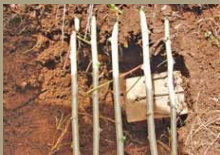
Weka mtego kwenye shimo la fuko kisha funika kwa ustadi.

*Inashauriwa wakulima kutotumia sumu kukabili wanyama hawa, kwani aina ya sumu inayoweza kuwaua wanyama hawa ni kali na hatari kwa afya. Endapo utavuta hewa ya sumu hii, unaweza kupoteza maisha baada ya muda mfupi sana. Halikadhalika, sumu hii ni hatari kwa mazingira, mimea, na viumbe waliomo