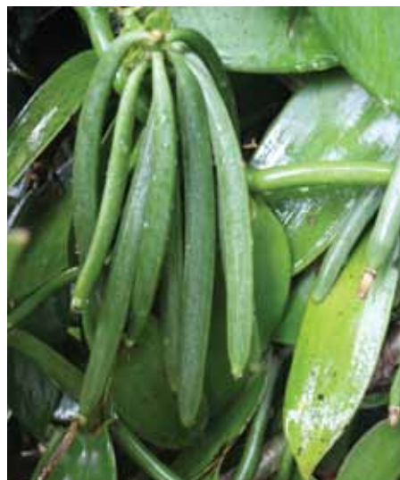
Ni muhimu kutunza zao la vanila kwa ustadi kwani utapata bei kubwa zaidi.