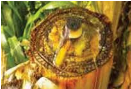
Unapokata shina la mgomba ulioathirika utaona utomvu mzito wenye rangi ya njano.