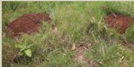
Unapooona udongo uliorundikana shambani mwako kwa mafungu kama huu kwenye pichani chukua tahadhari haraka kwani ni dalili za uwepo wa fuko.

kama vile viazi. Hali hii husababisha mimea kufa na hivyo kusababisha hasara kubwa kwa mkulima.