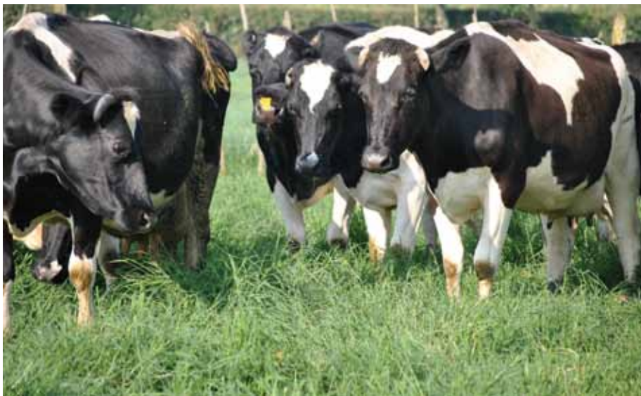
Malisho bora kwa ng'ombe wa maziwa ni muhimu kwa uzalishaji wa uhakika.

Hakikisha wakati wote unawalisha ng'ombe mchanganyiko wa majani na jamii ya mikunde. Kata majani yanayozidi na uhifadhi kwa ajili ya matumizi ya wakati wa kiangazi. Mfugaji mzuri, atakuwa na akiba ya chakula kwa ajili ya ng'ombe wake kinachoweza kutosheleza kwa kipindi cha miezi sita.