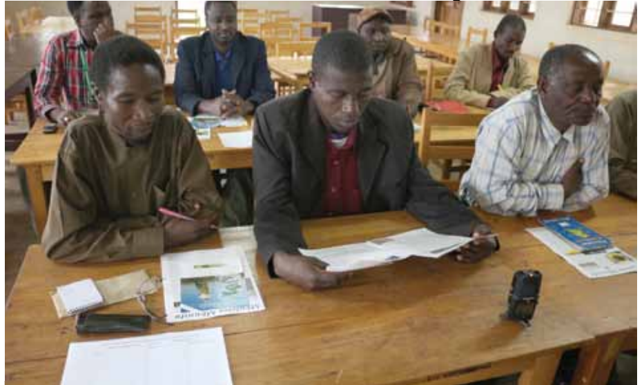
Baadhi ya viongozi wa vikundi vya wakulima Karagwe waliohudhuria mkutona kati ya MkM na FADECO.

Ili kufikisha ujumbe kwa wakulima na wafugaji walio wengi, FADECO imekuwa ikitumia kwa asilimia kubwa machapisho yanayotolewa na Mkulima Mbunifu , ikiwa ni pamoja na jarida lenyewe la MkM katika vipindi vyake. Hawakuishia hapo tu, bali pia FADECO imekuwa kiunganishi kikubwa kati ya MkM na wakulima katika eneo la Karagwe, na maeneo yote ya Kanda ya Ziwa Victoria.