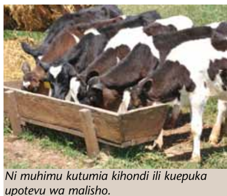
Ni muhimu kutumia kihondi ili kuepuka upotevu wa malisho.

Maji: Maji ni muhimu kwa maisha ya mifugo, lakini bado wafugaji walio wengi huwa hawazingatii jambo hili muhimu. Kila kilo moja ya maziwa huwa na gramu 870 za maji. Endapo ng'ombe hatapata maji ya kutosha, hatazalisha maziwa ya kutosha. Maji ni lazima yawepo zizini muda wote. ■