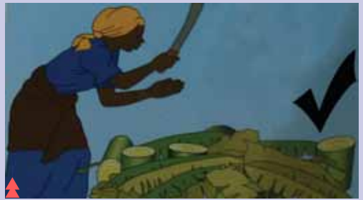
Fyeka migomba yote iliyoathirika.