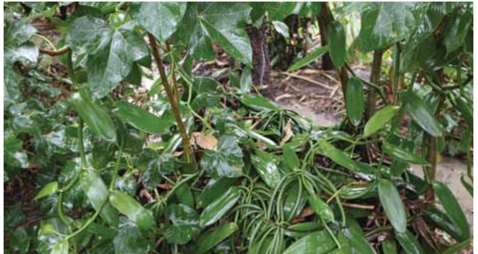
Vanila hupandwa pamoja na mmbono kaburi kwani hutegemea mmea huo kujilisha.

Kama huna banda la kuhifadhi na hakuna mvua, weka mbolea yako mahali pakavu na funika kwa kutumia majani mengi kiasi cha kutoruhusu mwanga wa jua kupenya na kuchoma mbolea yako kwani itapoteza virutubisho na ubora.