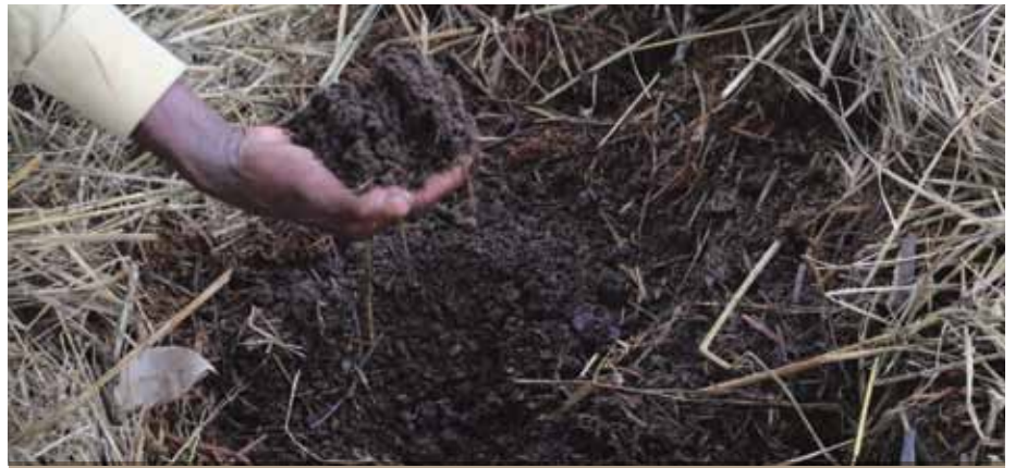
Unaweza kutumia kiganja kimoja cha mboji iliyo tayari kwenye kila shimo unapopanda.

kana na mtambo wa Biogas. Mboji aina hii huwekwa kiasi kidogo cha majivu (huwa na madini ya Potashiamu pamoja na lime kwenye mchanganyiko wake).