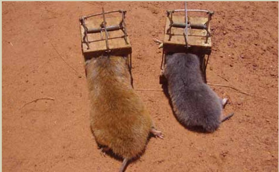
Hii ni aina moja ya fuko walio katika umri tofauti wakiwa wamenaswa.

Fuko hula mizizi ya mazao na sehemu ya chini ya shina la mmea husika pamoja na mazao yenyewe,