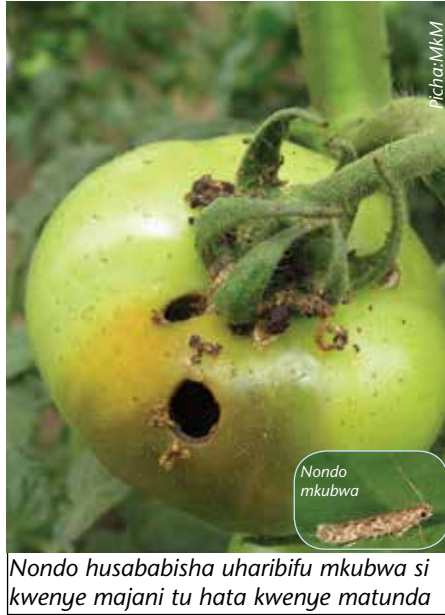
Nondo husababisha uharibifu mkubwa si kwenye majani tu hata kwenye matunda

Ukuaji wa buu hufanyika kwenye udongo na kwenye mimea yenyewe. Mdudu anapoevukia kwenye mmea,