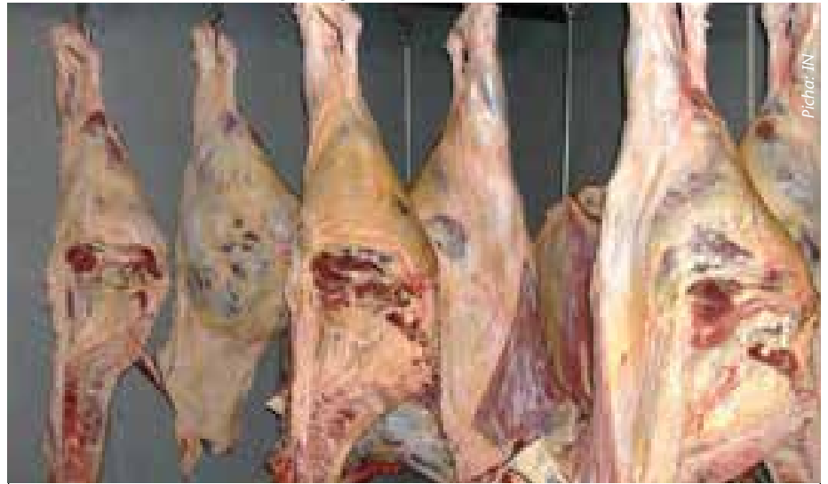
Hakikisha unazingatia usafi wa nyama pale unapochinja na kuuza bidhaa

Waveza kuwasiliana na mtaalamu Bw. Agustino Changula kwa namba 0784 70 50 98.