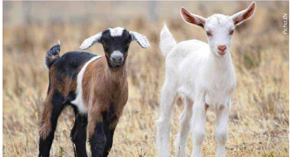
Vitoto vya mbuzi vinahitajika kupata usimamizi wa hali ya juu pindi tu wanapozaliwa