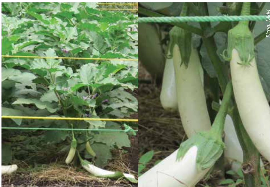
Ni muhimu kuweka matandazo ili kuzuia matunda kuoza yanapogusa udongo

Usimwagilie kipindi cha mvua kwani utasababisha bilinganya kuoza kutokana na wingi wa maji.