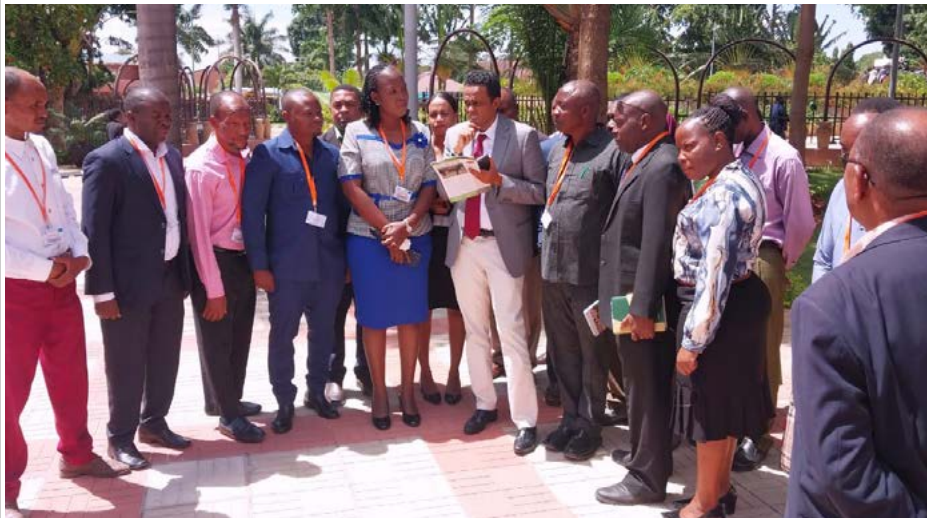
Mheshimiwa Waziri wa kilimo Hussein Bashe akiwa na wadau wa mbegu za asili Dodoma

Wajumbe wa kikosi kazi cha mbegu walipata nafasi ya kukutana na Waziri wa kilimo Mheshimiwa Hussein Bashe siku ya tarehe tano mwezi wa tano mwaka huu. Kabla ya kuanza kikao cha kamati ya kilimo ya Bunge.